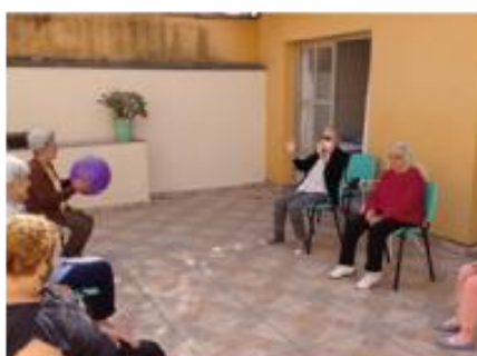
Atividade ao Ar Livre