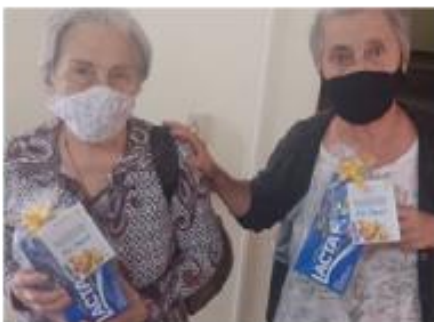
Aniversariantes do Mês