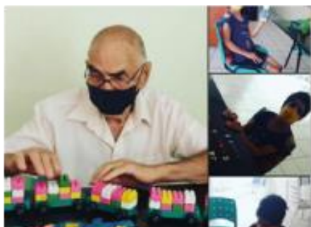
Bloco de Montar