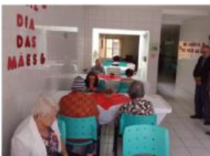
Almoço Dia das Mães