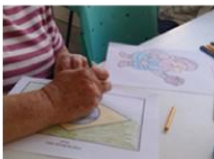
Pintura - Copa do Mundo