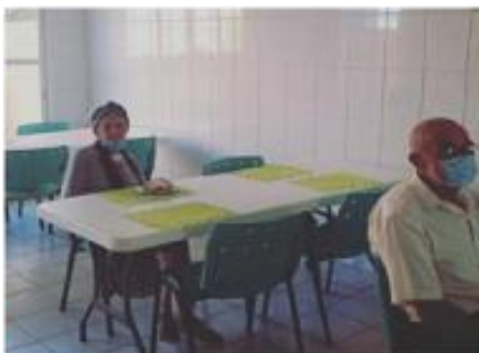
Hora do Café