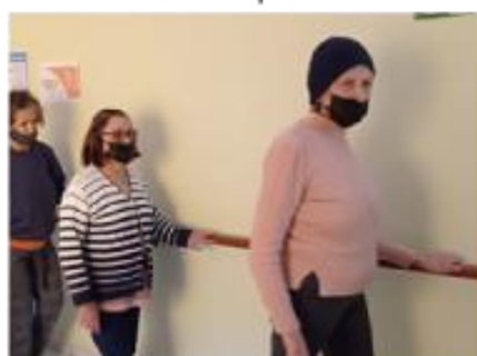
Treino da Marcha