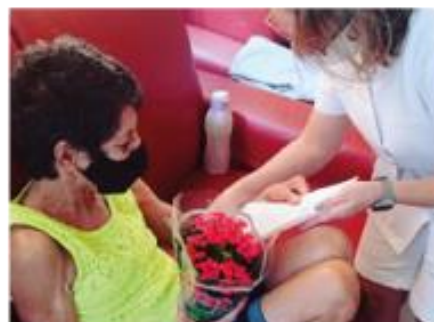
Dia Internacional das Mulheres