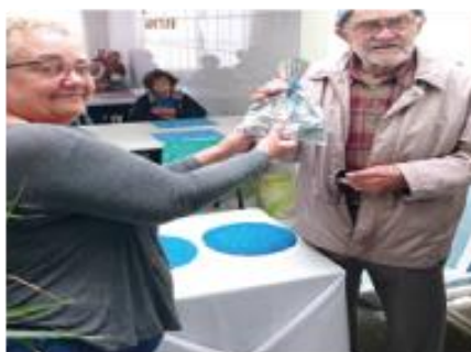
Dia dos Pais