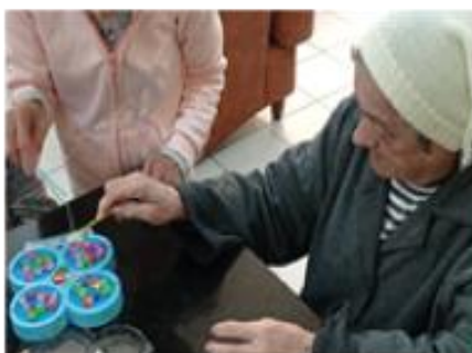
Treino de Agilidade