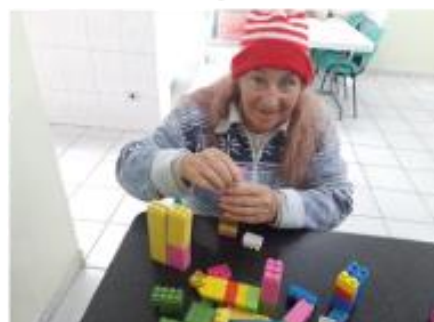
Usando a Imaginação